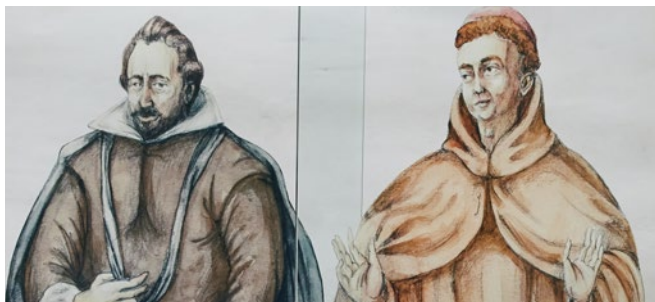
Herzog Wolfgang Wilhelm und ein Franziskanermönch