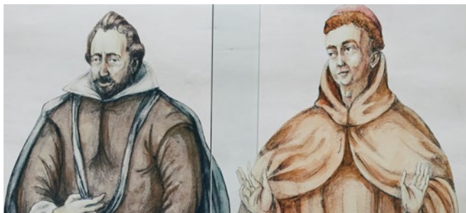
Herzog Wolfgang Wilhelm und ein Franziskanermönch