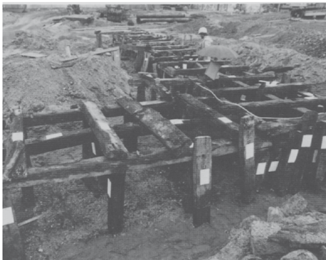
Holzrost-Gründung unter der Hafenbastion, 1994